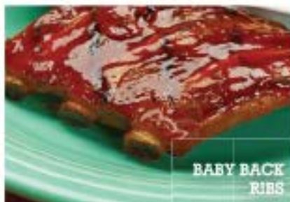
BABY BACK RIBS